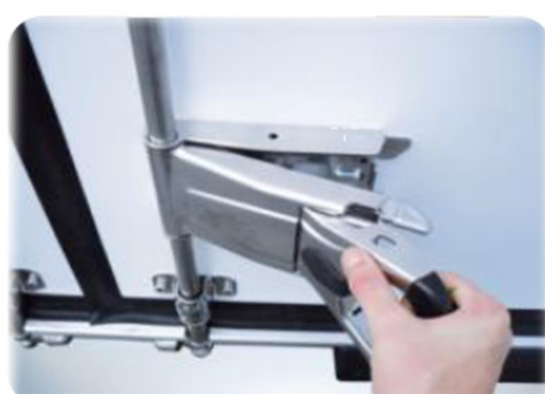
Нова ручка "Easy Handle" з одним рухом, на задніх дверях