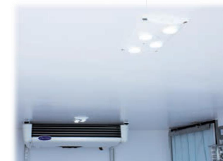
Світлодіодний світильник з перемикачем всередині кабіни