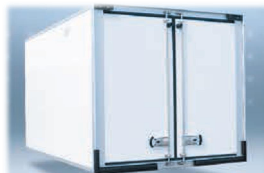
Композитні панелі (харчовий гелеобразний шар - поліефір - поліуретан), оснащені алюмінієвими вставкам