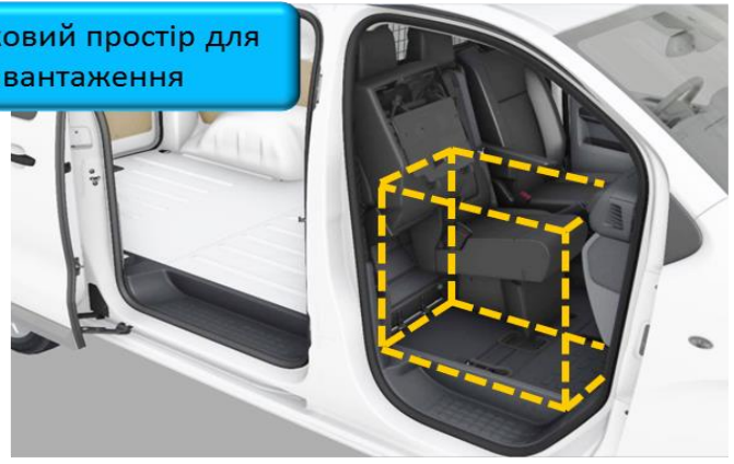
Додатковий простір для завантаження